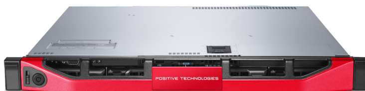
PT ISIM View Sensor

Система анализа и управления инцидентами PT Industrial Security Incident Manager, разработанная компанией Positive Technologies, призвана помочь решить актуальные проблемы и вывести промышленную кибербезопасность на новый уровень.